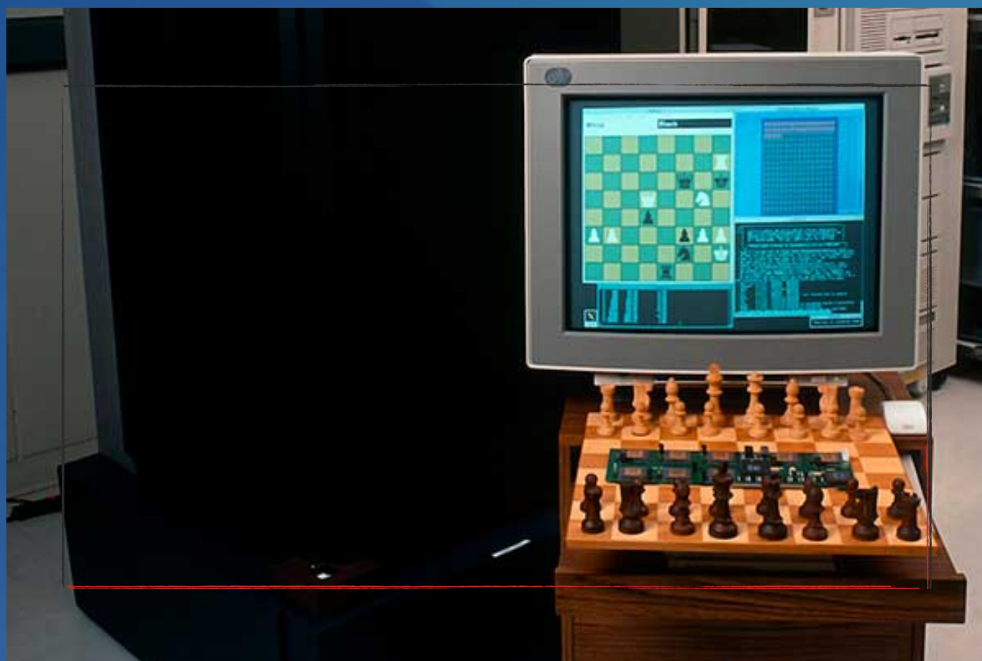
Deep Blue, la computadora que finalmente venció a Kasparov

Hace años ya que las computadoras juegan mejor que las personas.